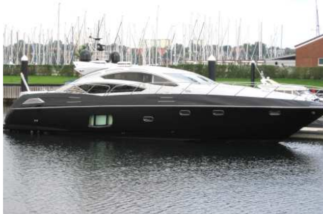
Die "Seewind" im Hafen von Neustadt. Bis zu 40 Knoten (74 Kilometer pro Stunde) kann ein solches Schiff erreichen. Dabei heben sich der Bug und vordere Fenster noch hoch